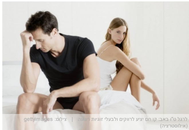
לרגל ט"ו באב: קו חם יציע לרווקים ולבעלי זוגיות יעוץ (אילוסטרציה)

לרגל ט"ו באב, פותח פורום CBT קו חם שייתן מענה פסיכולוגי לשבורי לב. "חדר המיון הטלפוני" יפעל לאורך כל יום האהבה ויספק יעוץ ראשוני חינם, על ידי מטפלים המתמחים בטיפול פסיכולוגי, קוגניטיבי והתנהגותי (CBT).